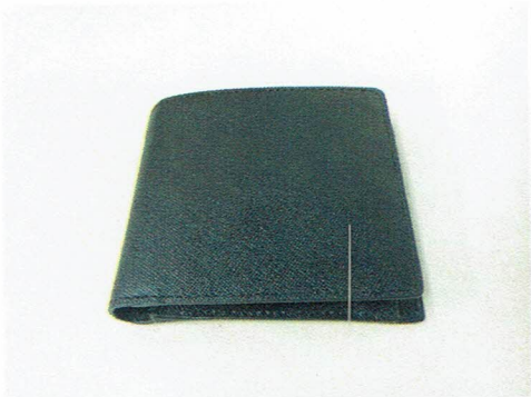
図 1 提出されたロイヤルサファイアーノレザーを使用したメンズ二つ折財布（saffi2ori）の写真

図 1 に提出されたロイヤルサファイアーノレザーを使用したメンズ二つ折財布（saffi2ori）の写真を、図 2 に試験片の採取箇所および試験片の写真を示す。また、標準試料として、当所所有の天然皮革（牛革）を用いた。