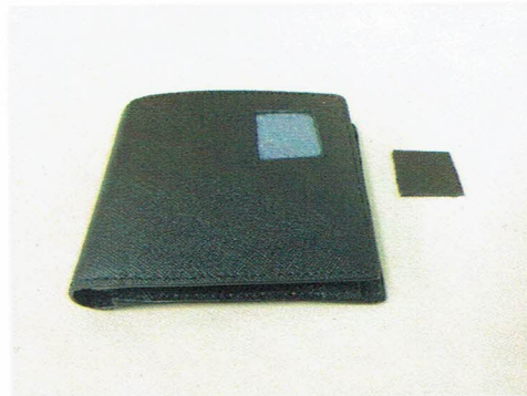
図 2 試験片の採取箇所および試験片の写真