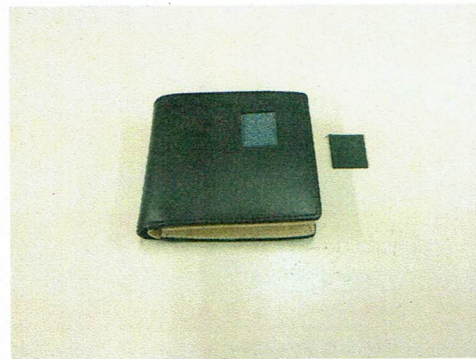
図 2 試験片の採取箇所および試験片の写真