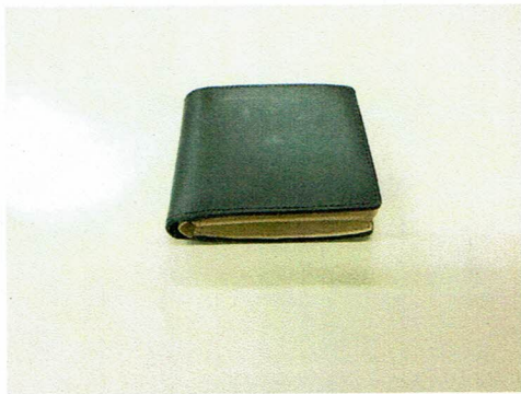
図 1 提出されたブライドルレザーで製作した メンズ二つ折財布（bridle2ori）の写真

図 1 に提出されたブライドルレザーで製作したメンズ二つ折財布（bridle2ori）の写真を、図 2 に試験片の採取箇所および試験片の写真を示す。また、標準試料として、当所所有の天然皮革（牛革）を用いた。