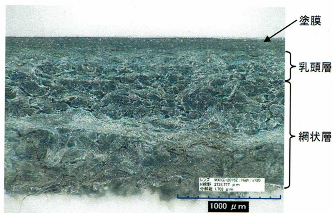
図3 提出された試料の表面に対して垂直方向の断面写真

図3に提出された試料の表面に対して垂直方向の断面写真を示す。試料の表側(写真の上側)から順に、塗膜、乳頭層、網状層が観察されている。図4に示した天然皮革(牛革)標準試料の断面と同じ構造を示しており、提出されたブライドルレザーで製作したメンズ二つ折財布(bridle2ori)の外側に使用されている素材は天然皮革であると推定される。